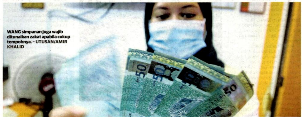
WANG simpanan juga wajib ditunaikan zakat apabila cukup tempohnya.

Pendeknya, mekanisme penyimpanan wang pada hari ini adalah pelbagai dan sangat variatif bentuknya. Wang simpanan tidak lagi boleh diindikasikan hanya kepada simpanan wang di bank semata-mata. Inti atau dasarnya, setiap wang simpanan itu ada zakatnya.