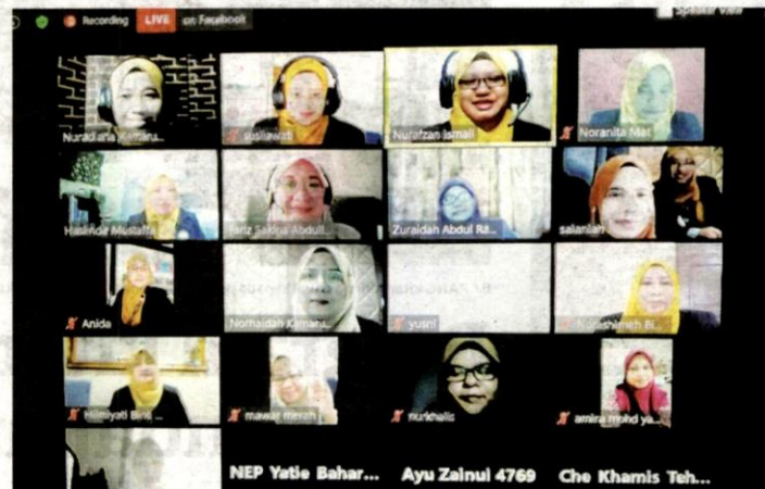
SEBAHAGIAN peserta program webinar Kepimpinan Wanita secara dalam talian, baru-baru ini.

Beliau berkata demikian semasa berucap merasmikan program webinar bual bicara, 'Kepimpinan Wanita- Apa Rahsia Mereka' secara maya di laman Facebook rasmi AKW-