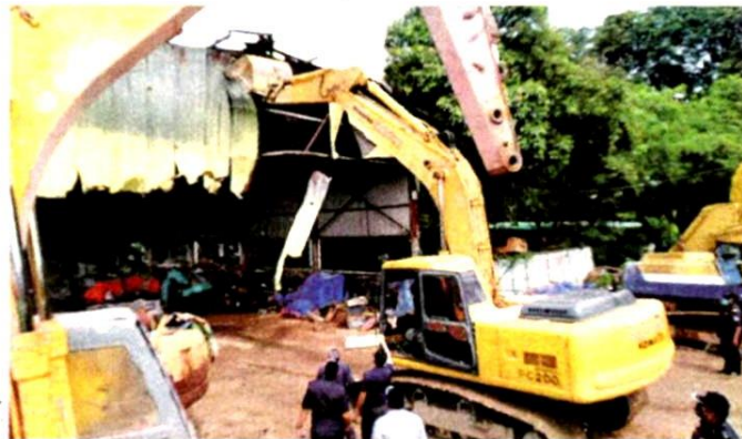
Bengkel jentera berat di Dato' Lee Kim Sai dirobohkan baru-baru ini.

RAWANG - Lebih 10 pengusaha kilang yang tampil membuat rayuan supaya tidak dikenakan tindakan penguatkuasaan kerana beroperasi berhampiran Sungai Rawang ditolak.