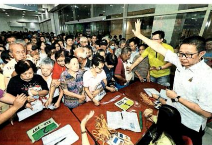
去年11月雪州巴生一场暖场的慈善活动上，由于出席人数太多，邓章钦多次感谢是民同好与幸甚，不尽鞠躬礼。 部分网民的留言，包括：“强烈挽留！国家现在更需要您这类难得的政治人才！正是千兵易得，一将难求，何况您已经师及(级)人才！”

(巴生3日讯)雪州行政议员拿督邓章钦在由网上载从政坛引退的贴文后，引起广大网民的不舍，不少人留言，也有不少人给予深深的祝福。 邓章钦以中英文发布其“退师表”，两则贴文都有不少网民留言及转载，当中的留言，也出现一些民间组织的代表及政坛领袖，他们也对邓章钦的决定给予祝福。 丹絨勿拉国会议员黄伟杰也留言感谢他对党及国家所做出的努力及贡献。 网民的留言，可以感受到他们对邓章钦引退的不舍，大部分都促三思，且希望他体面退去，但也有部分说他未来生涯规划一切如意，在其他领域依然勇往直前。