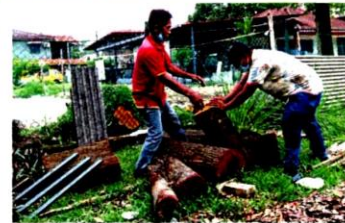
Contractors chopping down and removing one of the two trees that fell and damaged the porch and storeroom roofs of the kindergarten.

Since the children use the porch for assembly and outdoor activi-