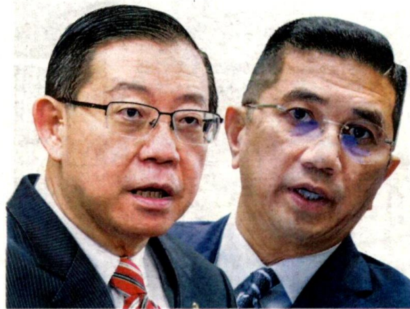
LIM GUAN ENG

"Mesyuarat APEC bukan sahaja pada 20 November, tapi persidangan APEC selama satu tahun yang bermula di Langkawi pada tahun 2019. Saya hanya menyambung tugas untuk menjayakan APEC 2020," katanya dalam ucapan perbincangan Rang Undang-undang (RUU) Perbekalan (Belanjawan) 2021 peringkat jawatankuasa di Dewan Rakyat