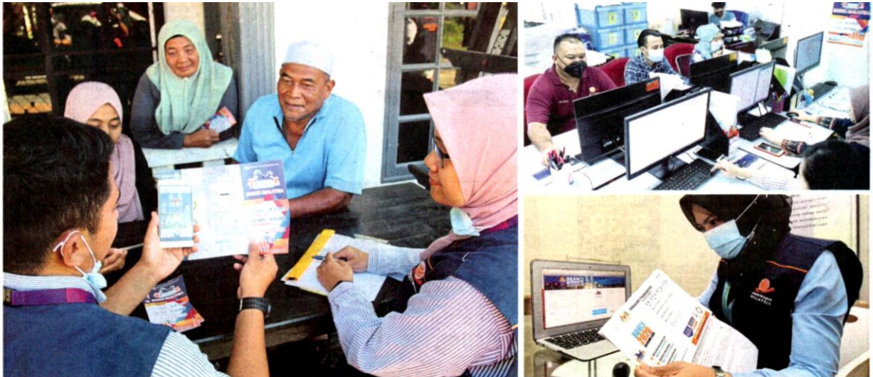
Proses bancian menggunakan kaedah e-CENSUS perlu diisi dengan tepat bagi membolehkan kerajaan merangka inisiatif berkesan dan bersesuaian.